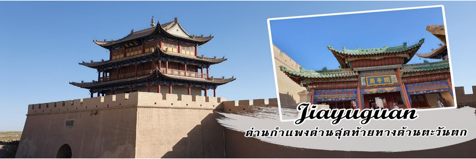
Jiayuguan ด่านกำแพงด่านสุดท้ายทางด้านตะวันตก

เช้า รับประทานอาหารเช้า ณ โรงแรม นำท่านชม ด่านเจียหยี่กวน เป็นด่านสุดท้ายของกำแพงเมืองจีนทางด้านตะวันตก เป็นจุดเริ่มต้นของกำแพงเมืองจีนที่ทอดยาวถึงด้านชั้นให้กวนทางภาคอีสานของจีน ชมปรากฏการสูง 773 เมตรเหนือระดับน้ำทะเล กำแพงสูง 10 เมตร ยาว 640 เมตร เป็นที่ตั้งของหอรังภัย ด้านหนึ่งทอดไปทางด้านตะวันตกเฉียงใต้สู่เทือกเขาฉินเหลียนชาน อีกด้านหนึ่งทอดไปทางทิศเหนือสู่เทือกเขาเป่ยชาน