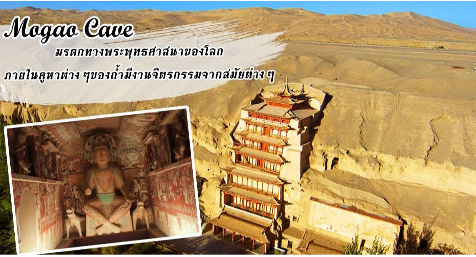
Mogao Cave มรดกทางพระพุทธศาสนาของโลก ภายในคูหาต่างๆของถ้ำมีงานจิตรกรรมจากสมัยต่างๆ

เช้า รับประทานอาหารเช้า ณ โรงแรม ก่อนเข้าชมถ้ำ นำท่านชมภาพยนตร์ 3 มิติ ที่เล่าเรื่องประวัติความเป็นมาของเส้นทางสายไหม การค้าขายและขนส่งสินค้าผ่านเส้นทางสายไหม การกำเนิดของ ถ้ำหินมั่วเกา และความเจริญรุ่งเรืองของพุทธศาสนาของแผ่นดินจีนในอดีต..... จากนั้นนำท่านชม ถ้ำโมเกา 莫高窟 มรดกโลกที่ยิ่งใหญ่อีกแห่งหนึ่งของโลก “ เป็นถ้ำที่มีคูหาใหญ่น้อยถึง 495 คูหา มีภาพวาดสีบนผนังสวยงามมีรูปแกะสลักพระพุทธรูปและองค์เจ้าแม่กวนอิม ปัจจุบันเปิดให้ชมเพียง 70 คูหาเท่านั้นในคูหาต้นๆ เป็นผลงานการบุกเบิกของพระสงฆ์เสอจุนในปี ค.ศ.366 ส่วนคูหาสุดท้ายขุดเมื่อยุคที่มองโกลมีชัยชนะเหนืออาณาจักรจีนใน ปี ค.ศ. 1277 ตั้งนั้น ปฏิมากรรมหรือจิตรกรรมที่ท่านจะได้ชมที่ถ้ำโมเกาแห่งนี้เกิดจากความเพียรพยายามของจิตรกรและช่างหลากหลายยุคหลายสมัยตลอดช่วงประวัติศาสตร์ที่นับเนื่องยาวนานเกือบ 1,000 ปี ศิลปะที่ถ้ำฟาโมเกาส่วนใหญ่สร้างขึ้นในสมัยราชวงศ์สุยและถัง ภาพวาดสมัยราชวงศ์ถังส่วนมากเป็นนางฟ้าล่องลอยในอากาศ ซึ่งถือเป็นเอกลักษณ์ของศิลปะถ้ำที่ตุนหวง ภาพเขียนสีภายในถ้ำ เป็นเรื่องราวของความดี-ความชั่ว และความสุขนิรันดร์ในสรวงสวรรค์ คล้ายกับว่าสวรรค์ และโลกเป็นเอกภาพเดียวกันในจำนวนถ้ำ 492 ถ้ำโมเกา (Mogao) เป็นถ้ำมีขนาดใหญ่ที่สุดและอายุเก่าแก่มาก แกะสลักหน้าผาทางซีกตะวันออกของภูเขาหิมิงซา รวมความยาว 1,600 เมตร ทุกตารางนิ้วของผนังถ้ำเต็มไปด้วยภาพวาดและรูปสลักทางศาสนา และถ้ำแห่งนี้มีภาพผนังกินเนื้อที่กว่า 45,000 ตารางเมตร นักโบราณคดีตะวันตกขนานนามภาพผนังแห่งนี้ว่า “ห้องสมุดบนผนัง”